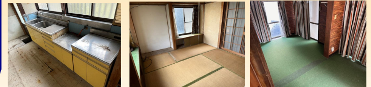
現況有姿売買となります

◆所在地／大分県別府市石垣東六丁目1689番地以上の土地付建物 ◆土地面積／公簿148.88㎡(約45.03坪) ◆建物構造等／居宅・木造2階建 1階51.99㎡・2階44.66㎡ 合計96.65㎡(約29.23坪) 昭和40年10月築 ◆用途地域／市街化区域 商業地域 ◆建蔽率／80% ◆容積率／400% ◆地目／宅地 ◆法令上の制限／景観法(別府市景観条例)・別府市環境保全条例・文化財保護法(末行遺跡) ◆現況／空家(内覧可) ◆引渡／相談 ◆接道／西側 公道 別府市道に約2.0m接す ◆取引態様／媒介 ◆間取り／7DK ◆駐車場／軽自動車2台程度可(縦列) ◆設備／公営水道、電気、LPG、公共下水 ◆浴室は別棟となっており、増築後未登記と思われます(時期不詳) ◆町内会費300円/月・組費300円/月